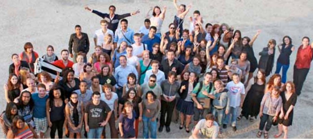
La première promotion du Service Civique au séminaire de Bugeat (19), en juillet 2012.