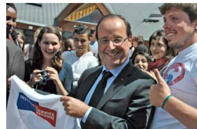
François Hollande, président de la République, a ouvert le premier séminaire de l'Institut du Service Civique.

Il s'est déroulé à Bugeat (19), dans le cadre d'un partenariat avec le conseil général de la Corrèze. Pendant huit jours, en immersion totale, les lauréats ont participé à des ateliers, suivi des conférences, et organisé leurs propres animations.